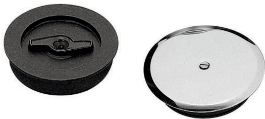
Tappo ad espansione per pozzetto