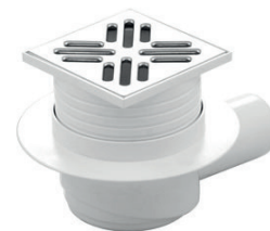
Sifoni scarico pavimento 100 x 100 uscita ø 50