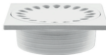
Pozzetto scarico pavimento