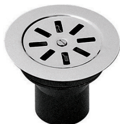
Tappo ad espansione a griglia con placca grigliata inox

Grid expansion plug with stainless plate