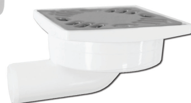
Sifoni scarico ribassato pavimento 100 x 100 in plastica, griglia inox

Floor drain slim traps 100 x 100 in plastic, inox grid