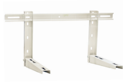
Staffa di sostegno con traversa Wall bracket with traverse