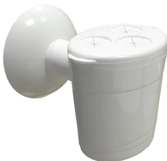
Sifone scarico condensa esterno per impianti aria condizionata e caldaie a condensazione

Condensation external drain siphon for air conditioning systems and condensing boilers