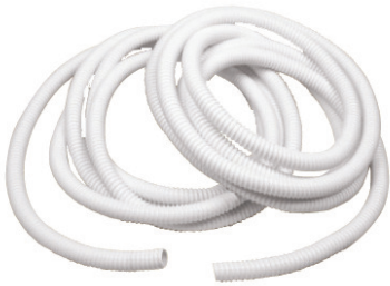
Rotolo tubo scarico condensa Roll pipe for condensate drainage